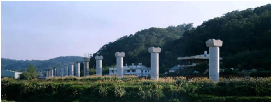
桃园机场捷运线

台湾之后我开始关注环境，我现在大概有两个部分：一个是比较概念性的东西，当然拍的环境也放了一点概念的因素，那个诠释的部分会更多放在怎么让影像跟环境的部分结合，所以你可以看到我那张照片调子很轻。