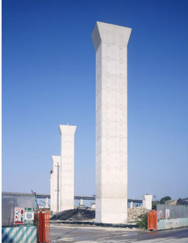
台中生活圈4号