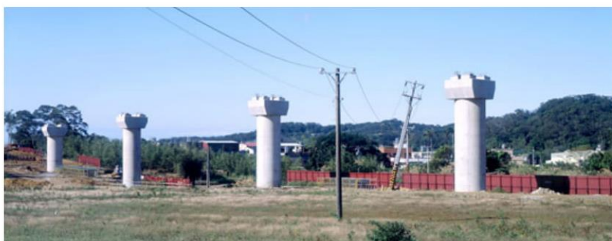
机场捷运-芦竹

钟顺龙：回到台湾之后，我记得大概第二年，当时台湾在修高速铁路，从台北到台南，我忽然间意识到台北到高雄很近，本来是一个比较遥远的概念，忽然间很近，那个瞬间的过程让我觉得整个空间压缩，那个时候就是那种状态。当时也有其它的公路在修，现在台湾有一个雪山隧道。因为我家住在花莲，如果回到花莲，台湾的东部，必须得翻山越岭经过一个叫做北宜公路，一个叫苏花公路，现在那个雪山隧道开通之后，就把北宜公路这一段撤掉了，我现在经过雪山隧道之后本来一个半小时的车程变成半小时，那个改变是很大的，后来我才开始说这些东西的支撑物就是那些柱子。