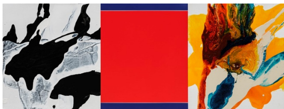
曲德義，複調 B2301 · 2023 壓克力、麻布 49 x 130 cm