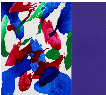
曲德義，變奏 C2105 · 2021 壓克力、麻布 130 x (97+49) cm

曲德義，1952年生於韓國井邑，大學返台1976年畢業於國立臺灣師範大學美術系，後旅居法國，1983年、1984年先後獲得法國國立高等設計學院美術設計碩士學位、法國國立高等美術學院造型美術碩士學位。1985年他接受邀聘返國致力於臺灣高等藝術教育、現當代藝術推廣及國際交流，帶領著台灣當代藝術的發展。曾任國立臺北藝術大學關渡美術館館長，以及財團法人李仲生現代繪畫文教基金會董事。目前擔任國立臺灣美術館與臺北市立美術館之諮詢委員、典藏委員、評審委員，以及文化部、國家文化藝術基金會等機構多項美術獎項、公共藝術設置案執行小組與評審委員。曾應邀於澳洲、法國、韓國、日本、英國等院校擔任客座教授或訪問學者。其作品曾多次以個展和聯展的方式在世界各地展出，作品獲得國立臺灣美術館、臺北市立美術館、高雄市立美術館、澳洲白兔美術館、韓國首爾市立美術館、光州市立美術館與私人收藏。