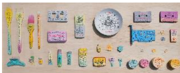
林書楷 · 陽台城市文明系列-喃喃齊物誌:再生文明 · 2022 複合媒材 110 x 50 x 100 cm