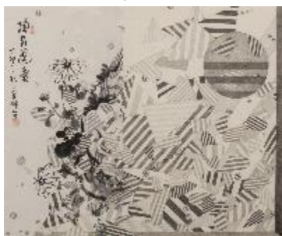
劉文瑄 · 對畫京都：蘭畦 #3 · 2016 鉛筆畫、京都跳蚤市場的水墨畫、楮皮紙 39.5 x 32.5 x 3.5 cm