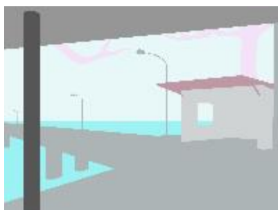
林昆穎 · 天光公路 · 2017 錄像裝置、壓克力顏料、 畫布 繪畫 160 x 120 x 5 cm 錄像 Full HD, 8' 00' ' Ed.1/2. +1AP

「沒有見過亞伯拉罕」，藉由此次展覽集結七位藝術家，以不同的創作風格和手法，展現當代臺灣藝術的多樣面貌和豐富氛圍，透過作品探索跨界、混種的概念及自身脈絡的發展，並呈現出對城市、社會、政治、生存等議題的反思，同時也透過媒材和形式的創新，拓展藝術領域的表現力和詮釋空間，為臺灣藝術界注入新的活力和靈感。