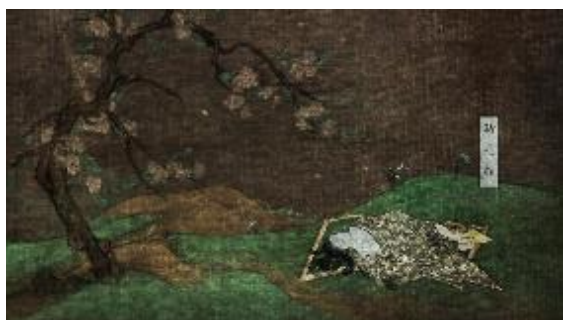
張立人 · 古典小電影系列 14 九相劇 · 2015 動畫裝置