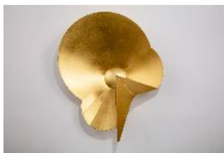
歐立婷 · 光 II · 2022 黃銅、蠟 66 x 52.5 x 17.5 cm